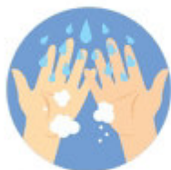
МЫЛО + ВОДА