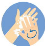
ЛАДОНЬ К ЛАДОНИ